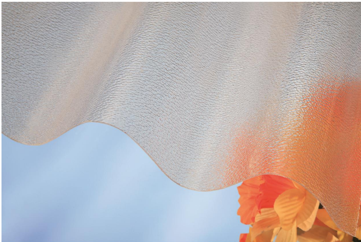
MARLON CSE VL 95/38 0,8 mm čirá