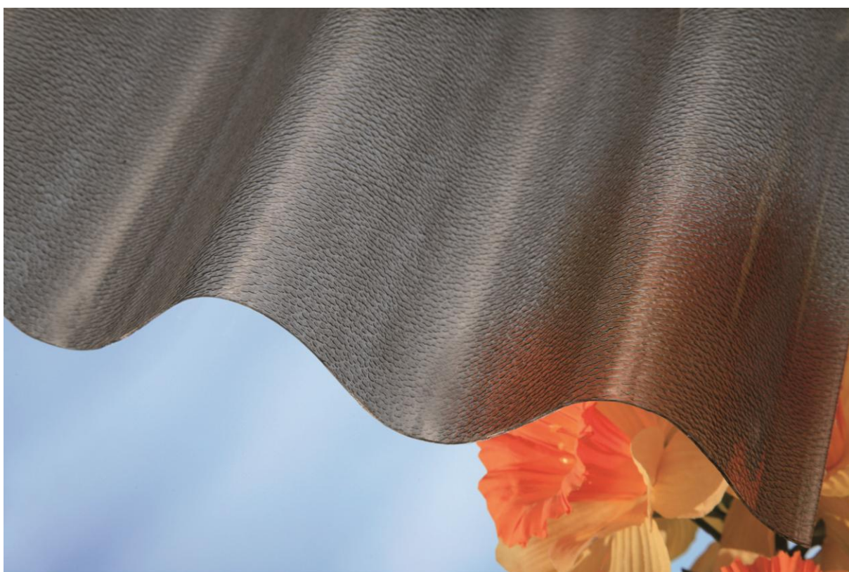
MARLON CSE VL 95/38 0,8 mm bronz